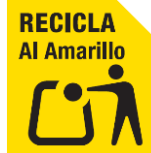
LÁMINA DE ALUMINIO